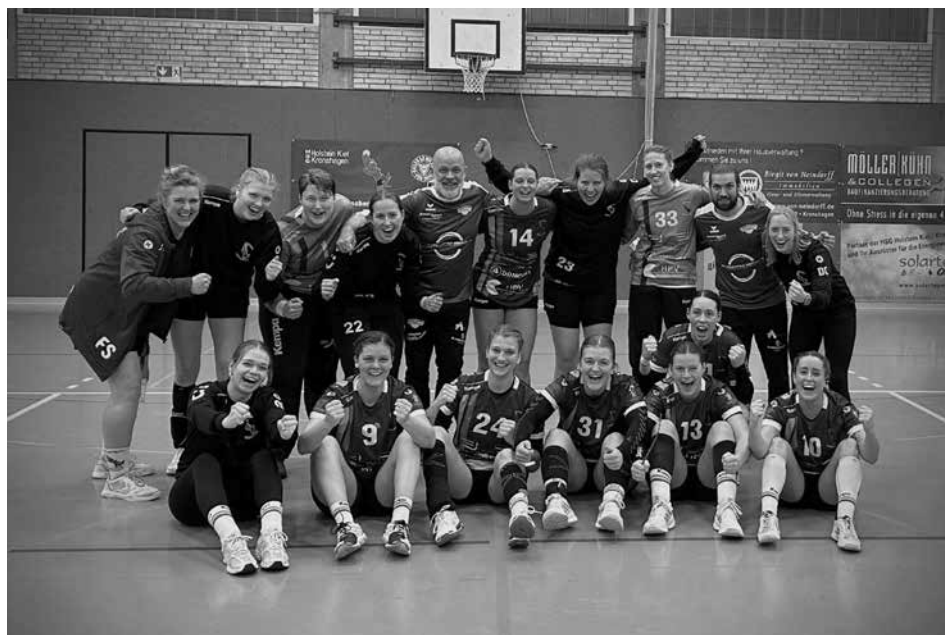
Handball HSG Frauen 1 nach Ihrem Sieg unter den neuen Trainern

Die Saison unserer zweiten Frauen hat mit einem etwas holprigen Start und einer sehr hohen Niederlage begonnen. Inzwischen zeigt sich aber eine positive Entwicklung und die Mannschaft findet immer besser zueinander, wodurch auch das Zusammenspiel und der Teamgeist auf dem Feld von Spiel zu Spiel harmonischer werden. Die Neuzugänge haben sich sowohl spielerisch, als auch menschlich optimal in das Team integriert. Diese Entwicklung spiegelt sich nun auch deutlich in unseren Leistungen und Ergebnissen wider, sodass wir auf einem guten Weg sind und uns auf die kommenden Spiele und Herausforderungen freuen!