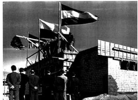
Richtfest beim Jugend- und Sportheim, Eichkoppelweg