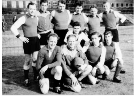
1957: Fußballmannschaft vor der Gebrüder Grimm Schule